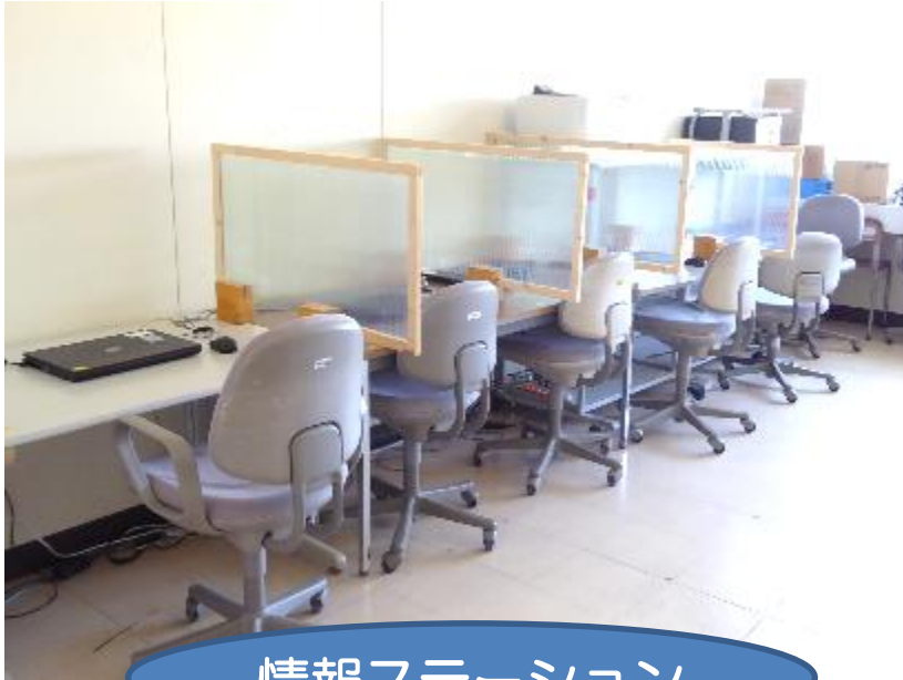
情報ステーション